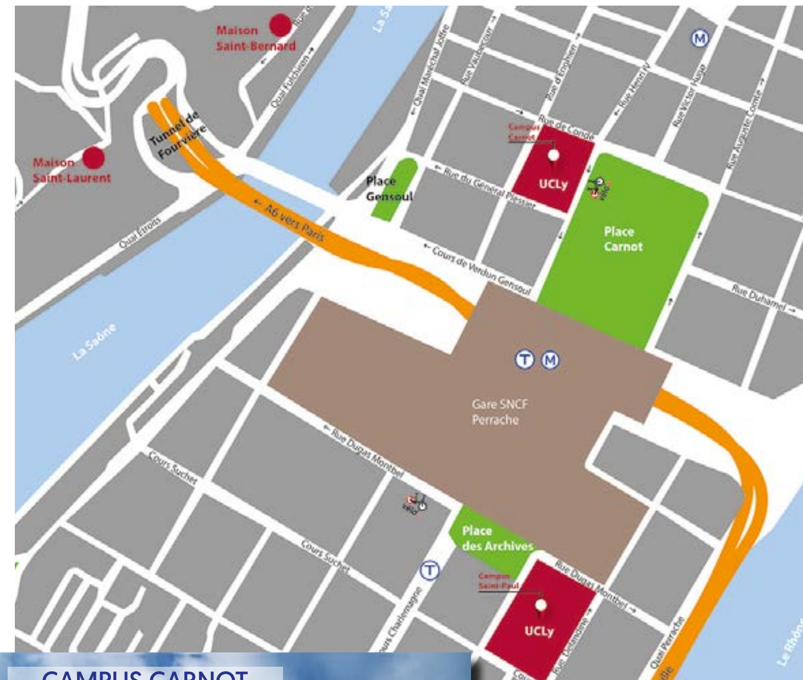
CAMPUS CARNOT 23, Place Carnot - Lyon 2 ème

Des sessions d'examens organisées tout au long de l'année. Calendrier disponible sur www.ilcf.net